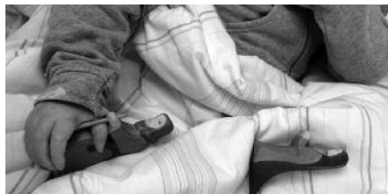
Maria und Josef im Krankenhaus

Was wäre, wenn Maria und Josef heute mitten unter uns auftauchen würden? Als Holzfiguren haben sie sich im Advent wieder auf den Weg durch unsere Gemeinde gemacht. Sie haben eine Menge gesehen von unserem Leben heute, wie schön und wie schwer es manchmal ist, zum Beispiel im Krankenhaus. Da, wo sie unterkamen, wurden sie herzlich willkommen geheißen und bekamen ausgesuchte Schlaforte. Gott kommt zu uns – nicht nur als Holzfigur – auch 2018.