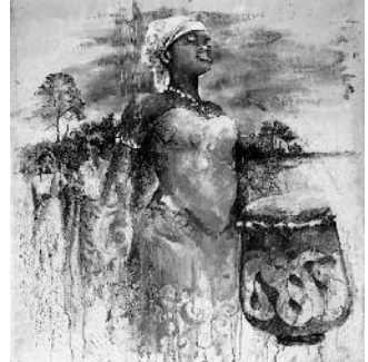
„ Gran tangi gi Mama Aisa ( In Dankbarkeit für Mutter Erde )“ von Sri Irodikromo

„ Gottes Schöpfung ist sehr gut! “ – Frauen aus Surinam laden ein zum Weltgebetstag Surinam ist das kleinste Land Südamerikas und nur halb so groß wie Deutschland. Es ist zu 90 % von Regenwald bedeckt. Die rund 540.000 Einwohner (Nachkommen der Urbevölkerung, der ehemaligen Sklaven und der Menschen, die aus Europa und Fernost dorthin kamen) leben fast nur in der Küstenregion, vor allem in der Hauptstadt Paramaribo, die zum UNESCO-Weltkulturerbe gehört. Die Vielfalt Surinams findet sich auch im Gottesdienst zum Weltgebetstag 2018 : Frauen verschiedener Herkunft erzählen aus ihrem Alltag. Leider ist das traditionell harmonische Zusammenleben in Surinam gefährdet, da die Wirtschaft des Landes extrem abhängig ist vom Export der Rohstoffe Gold und Öl. Das Sozialsystem ist nicht mehr bezahlbar, und viele Familien geraten in Not. Deshalb unterstützt das deutsche Weltgebetstagskomitee mit einem Teil der Kollekte die Ausbildung von jungen Frauen zu Sozialarbeiterinnen.