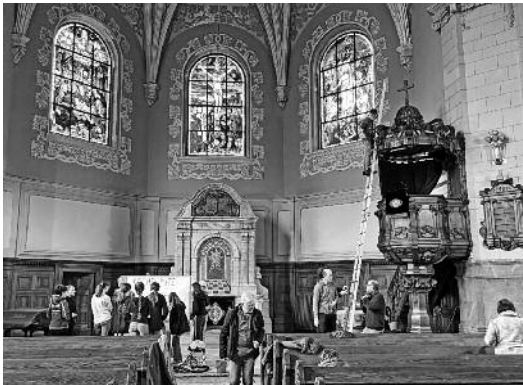
Wieder einmal haben viele fleißige Helfer und Helferinnen unsere Michaeliskirche mit großem Einsatz vom Winterschmutz befreit.