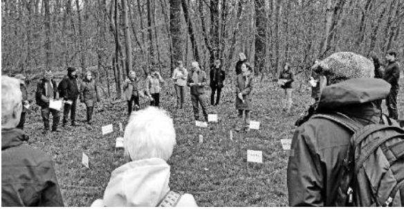
Ein Friedensort auf dem Pilgerweg durch den Leipziger Auwald am 25. März