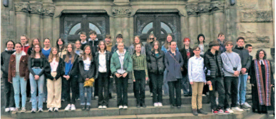
am Vorabend der Konfirmation