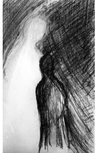
Engel des Lichts, Ausstellung in der Friedenskirche, siehe Seite 5