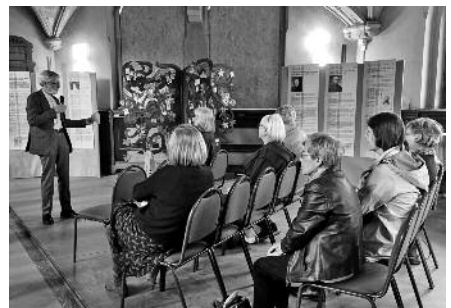
Eröffnung der Ausstellung am 1. Mai