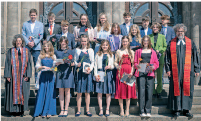
unsere Konfirmandinnen und Konfirmanden